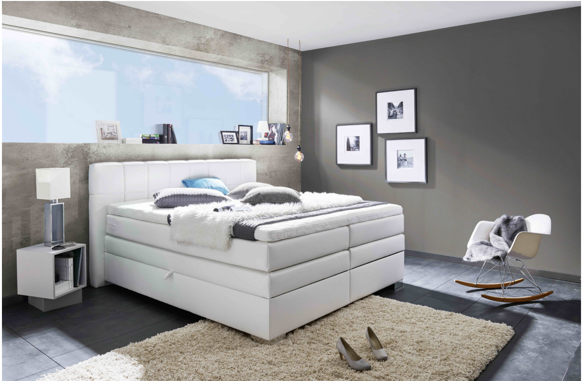
Modell Marina 2