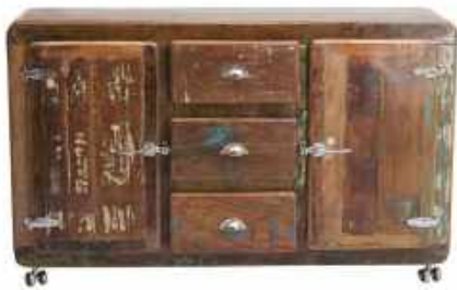
Sideboard 2603-98 59.1"Wx15.7"Dx35.4"H 150 x 40 x 90 cm