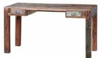
Schreibtisch/desk 2607-98 55.1"Wx23.6"Dx29.9"H 140 x 60 x 76 cm