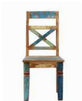
Stuhl/chair 09112-98 17.7"Wx17.7"Dx39.4"H 45 x 45 x 100 cm