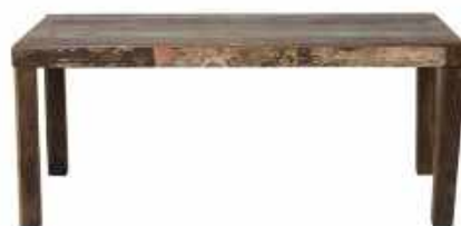
Tische/tables 2614-98: 55.1"Wx35.4"Dx29.9"H / 140 x 90 x 76 cm 2618-98: 70.9"Wx35.4"Dx29.9"H / 180 x 90 x 76 cm