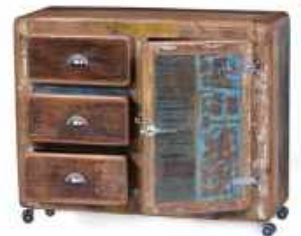
Kommode/chest 2609-98 39.4"Wx15.7"Dx35.4"H 100 x 40 x 90 cm