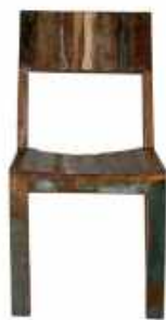
Stuhl/chair 02612-98 15.7"Wx 17.7"Dx39.4"H 44 x 45 x 89 cm