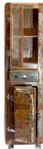
Hochschrank/tall cabinet 2605-98: opens from left 2606-98: opens from right 21.6"Wx14.96"Dx74.8"H 55 x 38 x 190 cm