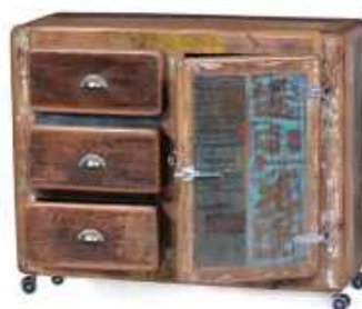
Kommode/chest 2609-98 39.4"Wx15.7"Dx35.4"H 100 x 40 x 90 cm