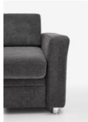
Armteil 1 18cm