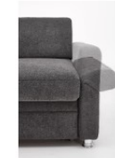
Liegearmlehne für Armteil 3