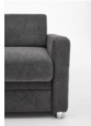
Armteil 3 13/23cm