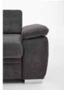
Armteil 2 28cm