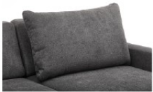
Rückenoptik A Spitzkissen Rückenkissen nicht in unterschiedlichen Bezügen innerhalb einer Type lieferbar!