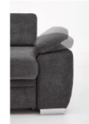
Armteilverstellung für Armteil 2