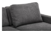
Rückenoptik B Bodenkissen Rückenkissen nicht in unterschiedlichen Bezügen innerhalb einer Type lieferbar!