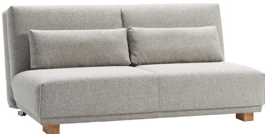
Janne Faltsofa 155, Bezug 30/3241 grau-beige