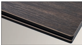
KB16SMOB Holzoptik barrique