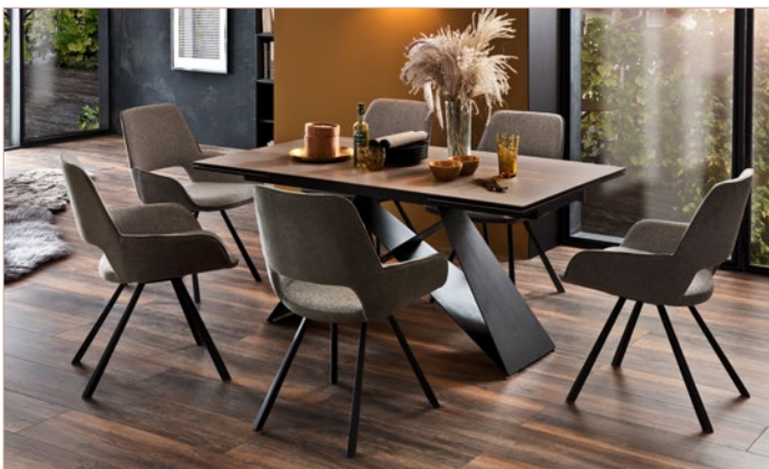
4-Fuß Stuhl PARANA mit Tisch KOBE