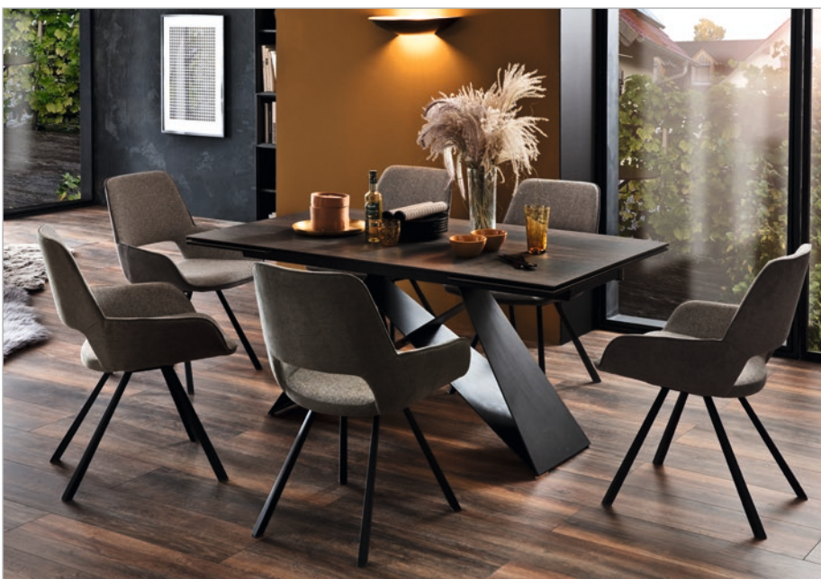
Tisch KOBE mit Stuhl PARANA