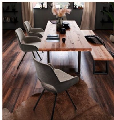
4-Fuß Stuhl PARANA mit Tisch & Bank CASTELLO