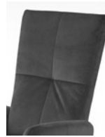
Typ B gesteppt