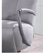
Typ 1 Metall chromfarbig

Gestell: Stahlrohrrahmen Polsterung: Sitz und Rücken: PUR-Schaum Armlehne: wahlweise: