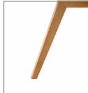
Holzfuß Eiche geölt P58 ohne Mehrpreis F M8