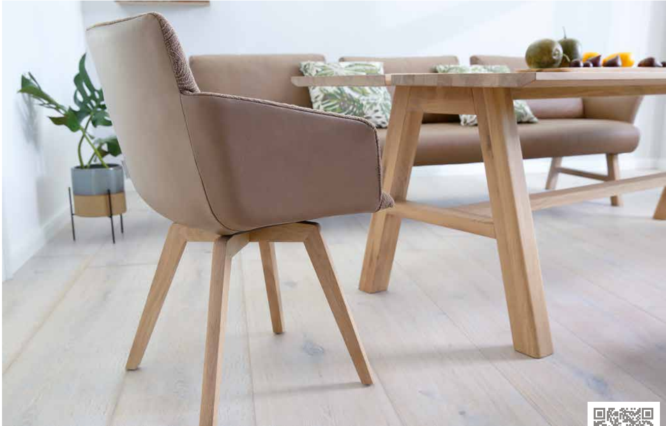
Bezüge: Z73/50 terra & W78/54 tobacco