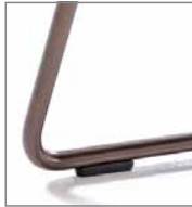
Drahtrohrgestell verschiedene Metallfarben F M5