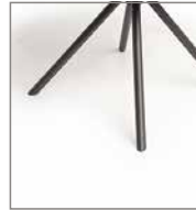
Stativgestell schwarz F 8A