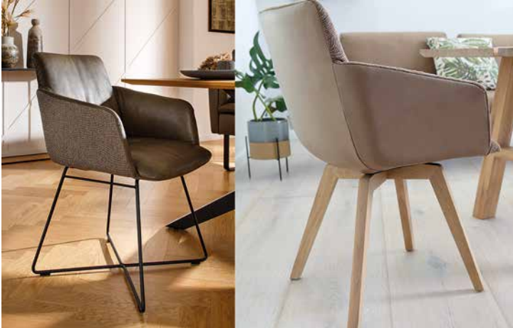
Bezüge: MX in Z75/36 & W78/36 camouflage und MY in Z73/50 terra & W78/54 tobacco