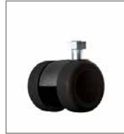
Parkettrolle (2 cm höher)