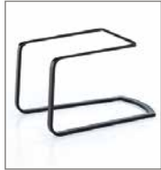
Freischwingerstuhl verschiedene Metallfarben