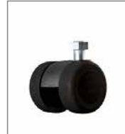
Parkettrolle (2 cm höher)