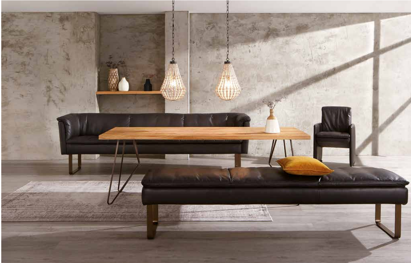
Bezug: Z62/54 zartbitter