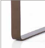
Metallkufe verschiedene Metallfarben