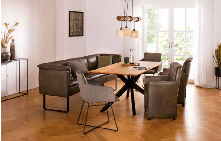
Bezug: Z75/36 camouflage