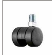
Kunststoff-Doppelrolle (2 cm höher)