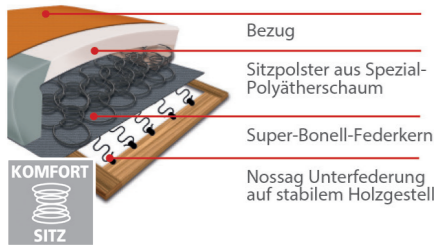
Komfortsitz mit Federkern