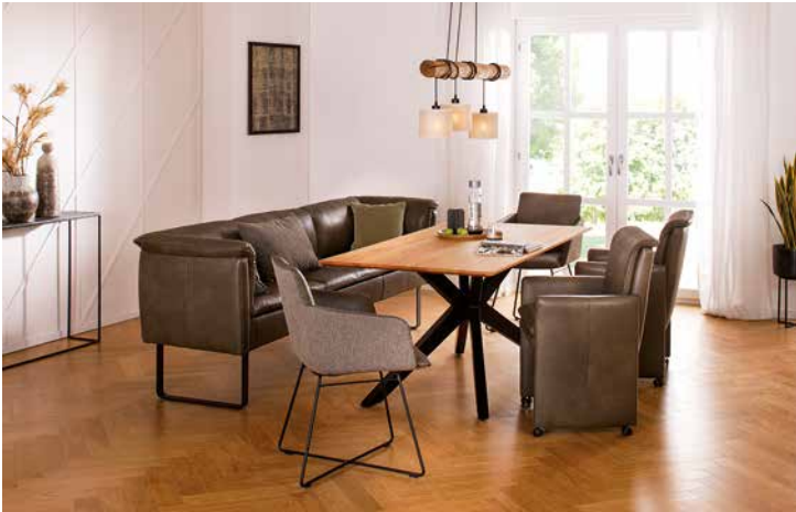
Bezug: Z75/36 camouflage