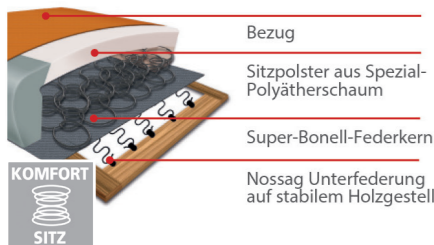
Komfortsitz mit Federkern