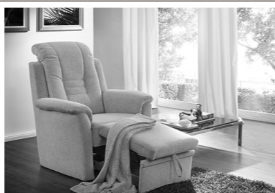
Sessel mit Fußhocker