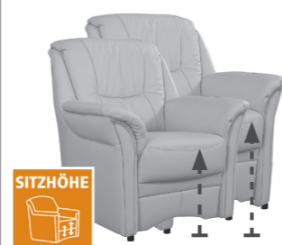
2 Sitzhöhen zur Auswahl Sitzhöhe 46 oder 49cm