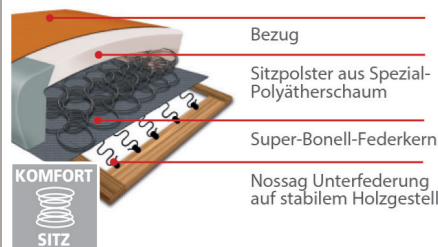
Komfortsitz mit Federkern