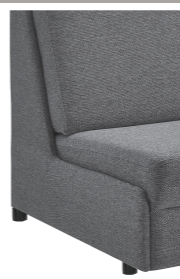
Abschlussblende alternativ zu einem Armteil möglich (Mehrpreis)