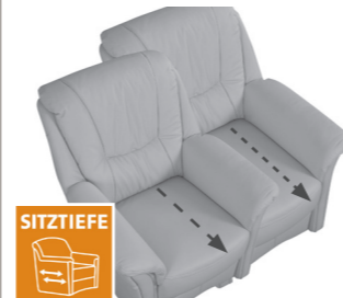
2 Sitztiefen zur Auswahl Sitztiefe L (53cm) oder Sitztiefe K (48cm)