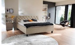
beige Nr. 02