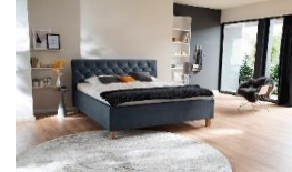
taubenblau Nr. 16