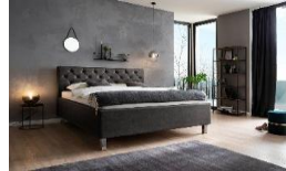
anthrazit Nr. 09