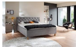
hellgrau Nr. 32