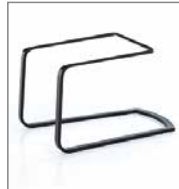
Freischwingergerüst verschiedene Metallfarben