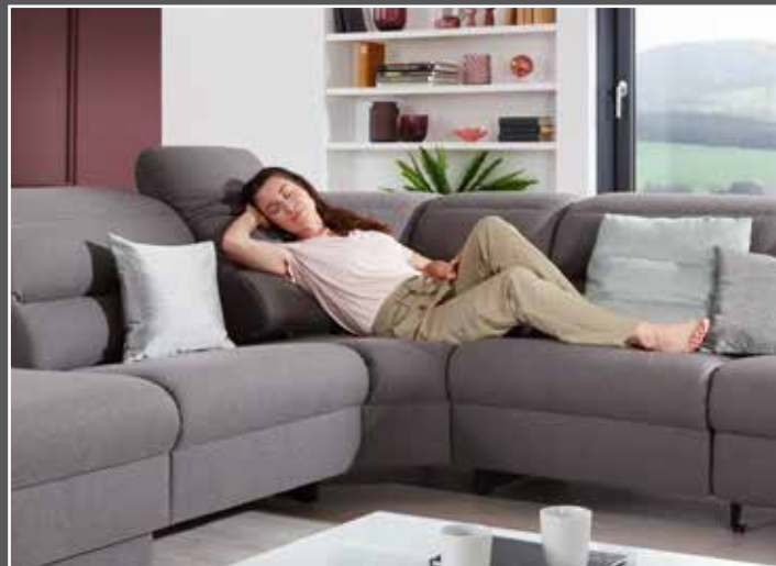
Variante 75 mit Relax-Funktion auf beiden Seiten