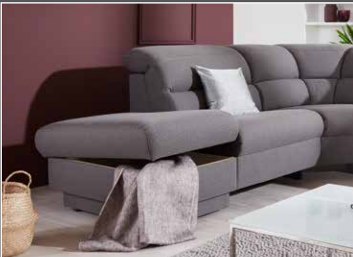
Variante 71 mit Stauraum