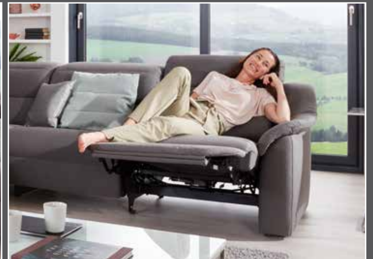
Variante 16 mit Wallfree-Funktion