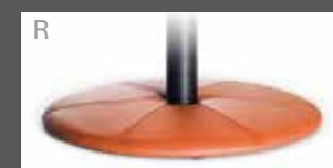
Bezogener Teller (Leder oder Stoff)