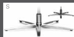
Metall-Sternfuß schmal - verchromt - Edelstahloptik - Anthrazit (pulverbeschichtet)