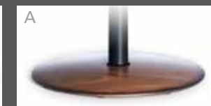
Holzteller in Buche (Farbe lt. Beiztonkarte)