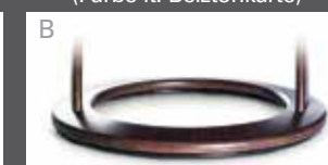
Holzdrehring in Buche (Farbe lt. Beiztonkarte)