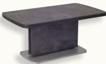
JM-02-02 Oberteil: Melamin Dekor Beton-Optik dunkel Unterteil: Melamin Dekor Beton-Optik dunkel