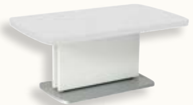
JM-04-04 Oberteil: Melamin Dekor weiß Unterteil: Melamin Dekor weiß