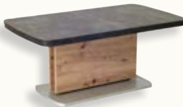
JM-02-01 Oberteil: Melamin Dekor Beton-Optik dunkel Unterteil: Melamin Dekor Wildeiche