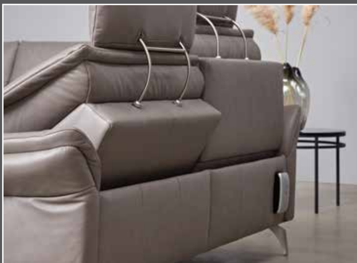
Variante 166 mit beidseitiger Wall-Free-Funktion