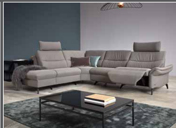
Zusammenstellung 585 / 156 in 24 Q2 Fashion grey