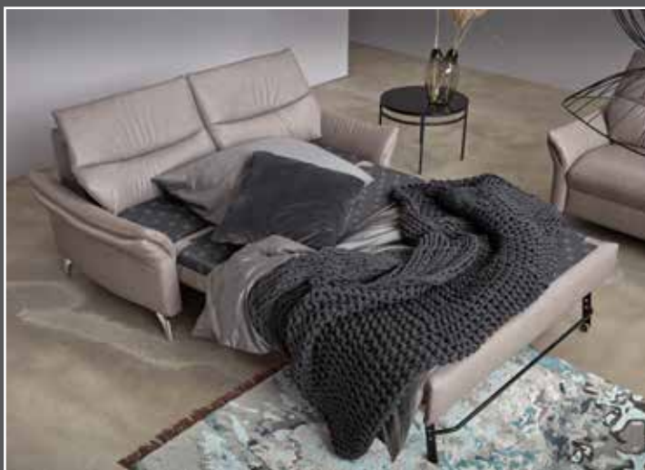
Variante 274 mit Bettfunktion und Armteilverstellung Liegefläche 135x190cm