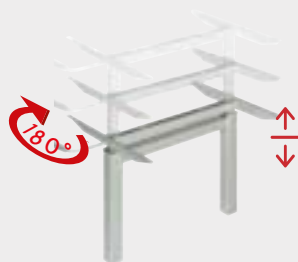
Ilse-Lift-Mechanik Beschreibung im Anhang