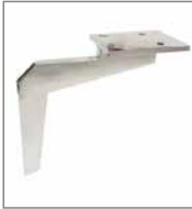
Metallfuß glänzend verschiedene Metallfarben F C4