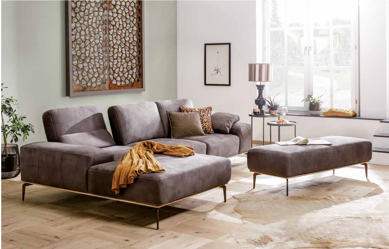
Bezug: S37/56 mocca