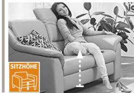
2 Sitzhöhen zur Auswahl