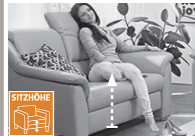
2 Sitzhöhen zur Auswahl