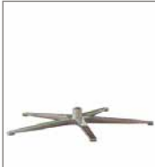
5-Sternfuß verschiedene Metallfarben 3 Sitzh. - FU1 F 99