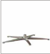
5-Sternfuß verschiedene Metallfarben 3 Sitzh. - FU1 F 99