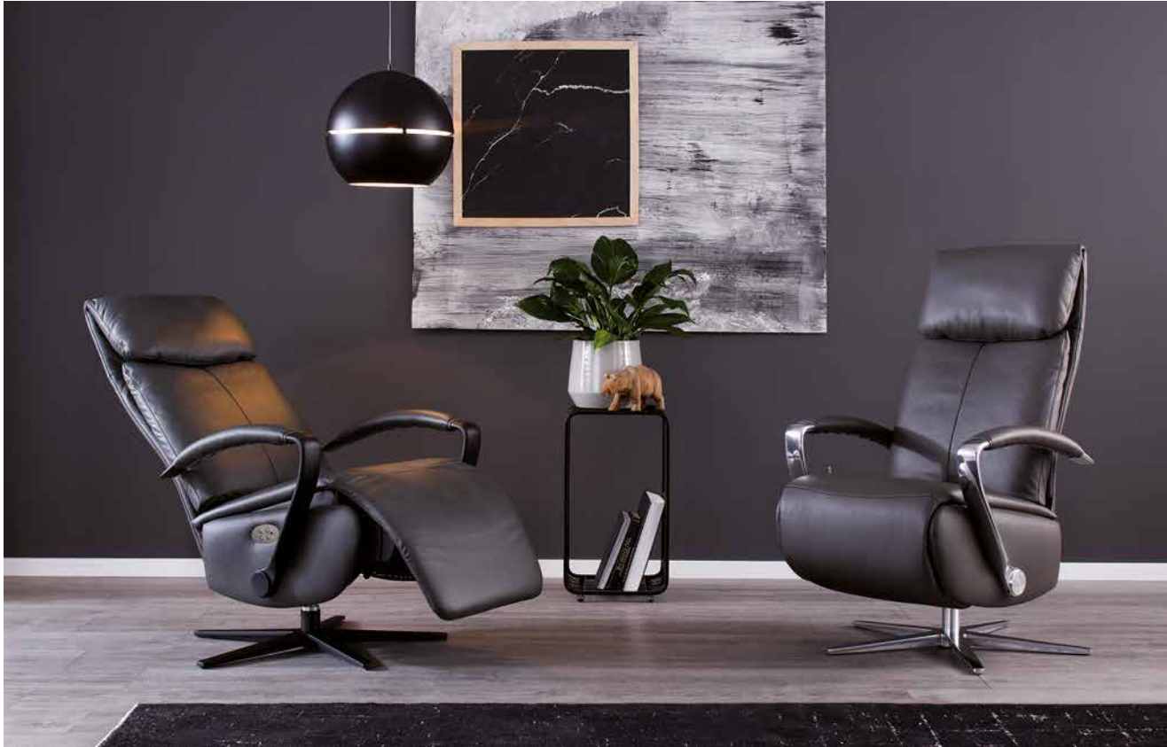
Bezug: Z69/95 anthracite