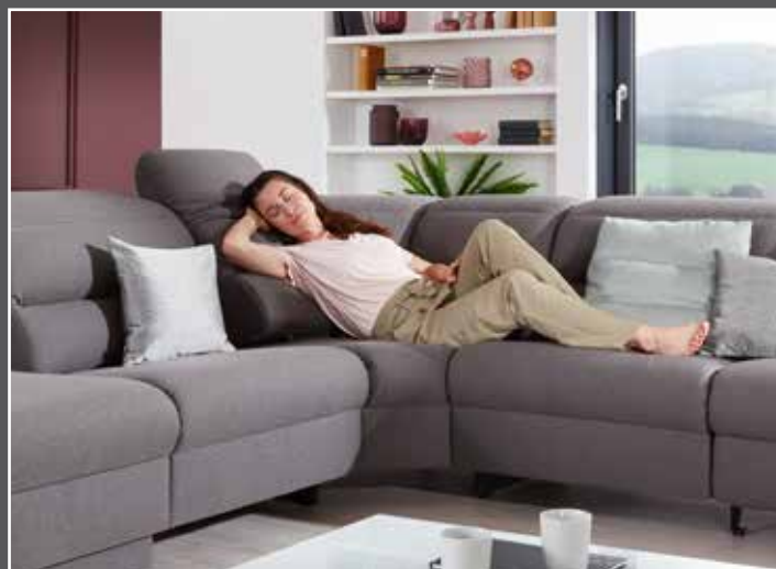
Variante 75 mit Relax-Funktion auf beiden Seiten