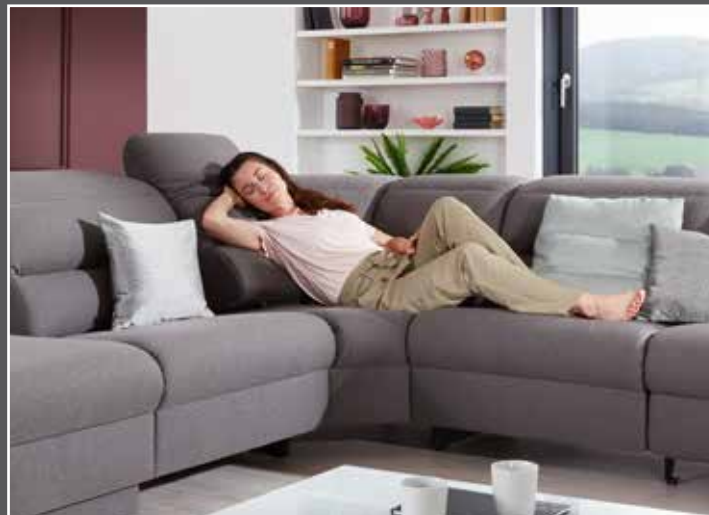
Variante 75 mit Relax-Funktion auf beiden Seiten