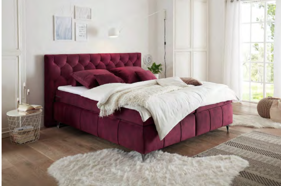
Salvador 06 burgund