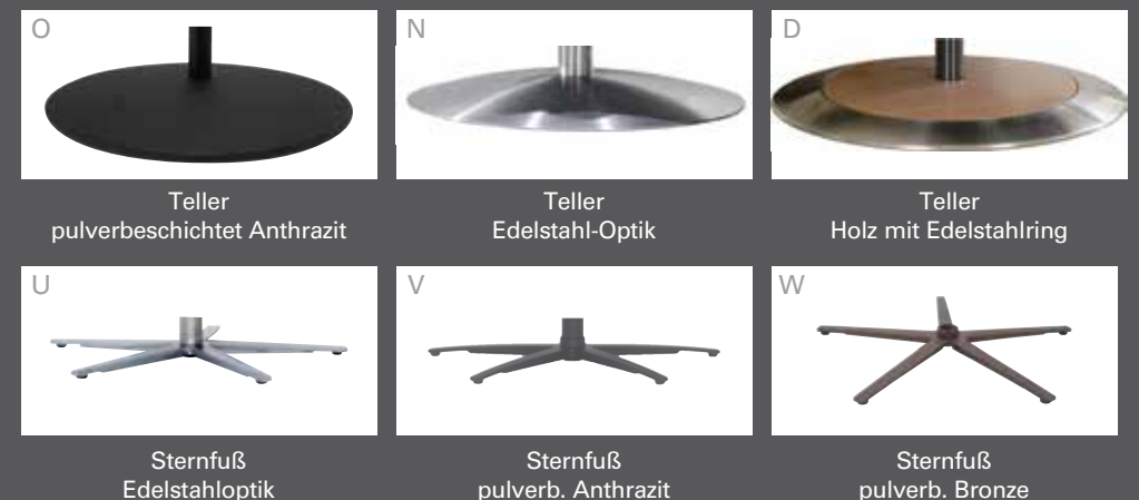
O Teller pulverbeschichtet Anthrazit