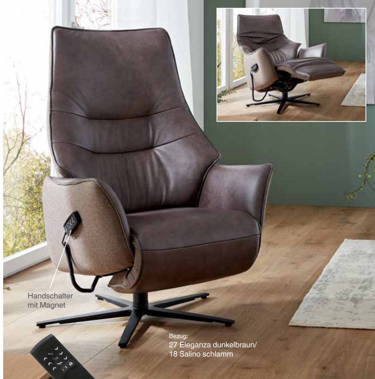
Handschalter mit Magnet