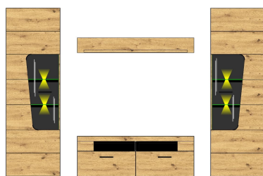
10 H4 HH 82