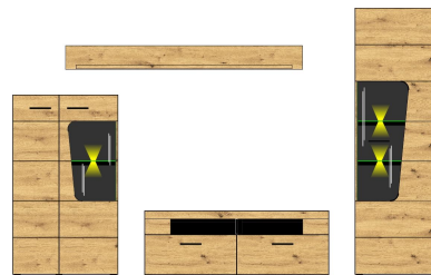
10 H4 HH 81

TV-/Wohnlösung inkl. LED-Beleuchtung best. aus Typen - 02/03/31/41