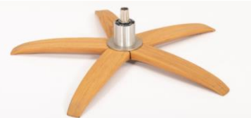
WSK Holzstern Fuß Schwarz