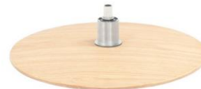
DBS Diskfuß Schwarz