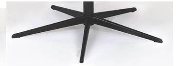
PBS Polaris-Base - Schwarz