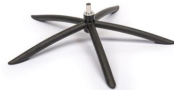
TSS2 Tube Space Metall Schwarz