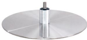
DBB Diskfuß - Metall gebürstet