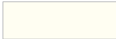
RAL 9010 reinweiß