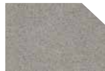
SCARLETT silvercreme 20