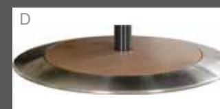
Holz mit Edelstahlring