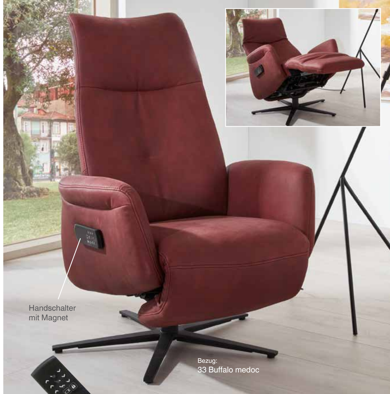
Handshalter mit Magnet