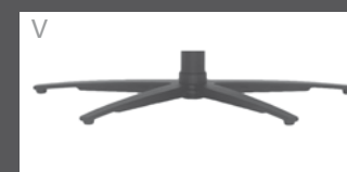
Sternfuß Anthrazit pulverbeschichtet

- alle elektrischen Varianten können mit aussenliegendem Akku geliefert werden.