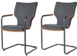
724C Komfort (rund) 727C Komfort (eckig)

Joni 724C / 727C Komfort - Bi-Color Mattenpolsterung* Matte >