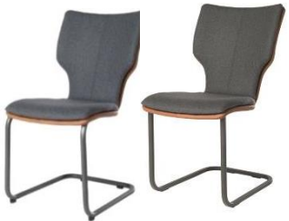
714C Komfort (rund)

Joni 714C / 717C Komfort - Bi-Color Mattenpolsterung* Matte >