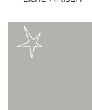
Hochglanz soft grey