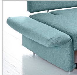
Typ 3 abklappbar