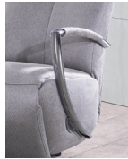
Typ 1 Metall chromfarbig

Gestell: Stahlrohrrahmen Polsterung: Sitz und Rücken: PUR-Schaum Armlehne: wahlweise: