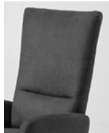
Typ A glatt