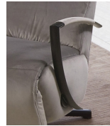
Typ 2 Metall schwarz matt