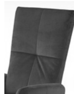
Typ B gesteppt