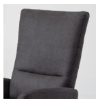
Typ A glatt