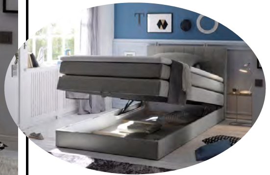
inkl. einem integrierten Bettkasten

Boxspringbett 120 x 200 cm mit Bettkasten