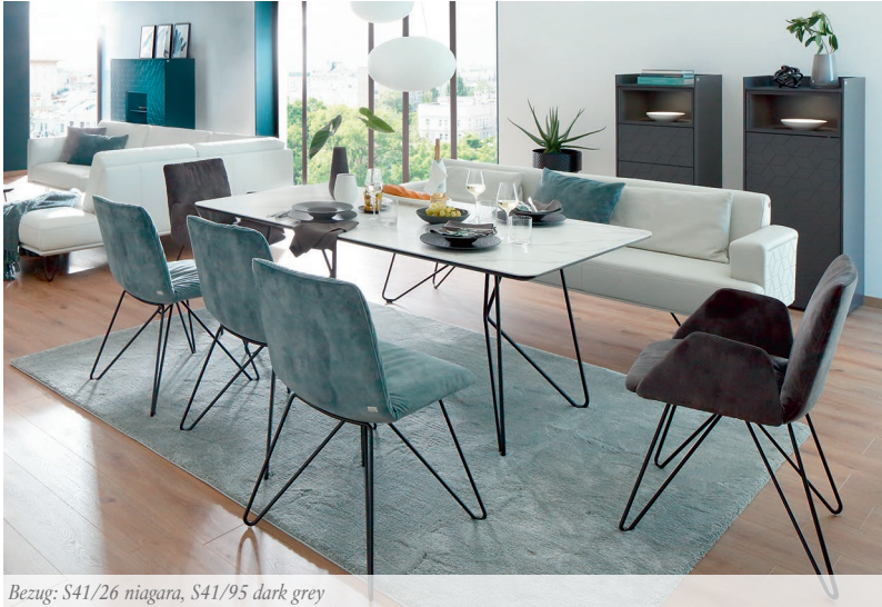
Bezug: S41/26 niagara, S41/95 dark grey