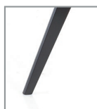
Holzgestell Eiche schwarz P99