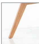
Holzgestell Eiche geölt P58