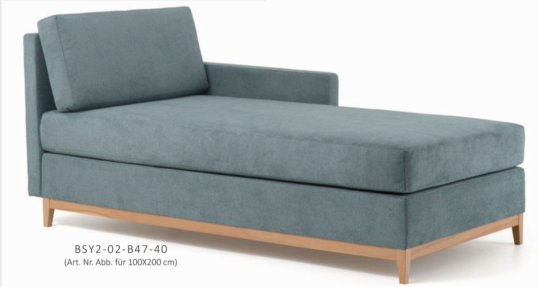
BSY2-02-B47-40 (Art. Nr. Abb. für 100X200 cm)