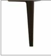
Metallfuß verschiedene Metallfarben