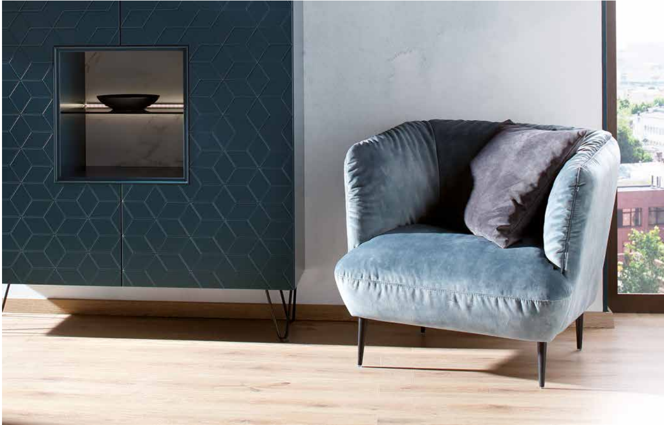
Bezug: S41/26 niagara