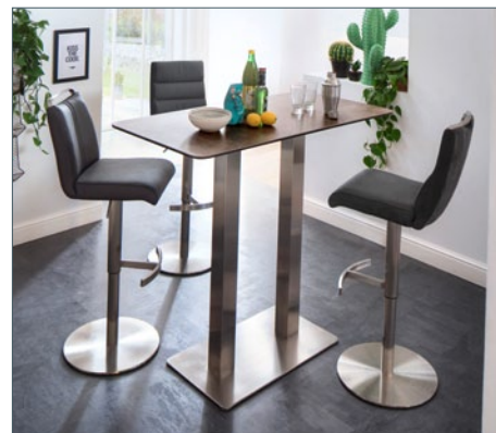
Bartisch ZARINA 3 mit Barstuhl GIULIA