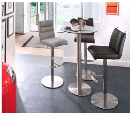
Bartisch ZARINA 1 mit Barstuhl GIULIA