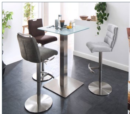
Bartisch ZARINA 2 mit Barstuhl GIULIA