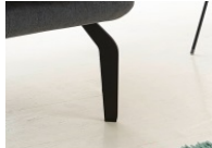
MF 60 / H = 23 cm