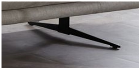
MF 59 Kufe / H = 23 cm