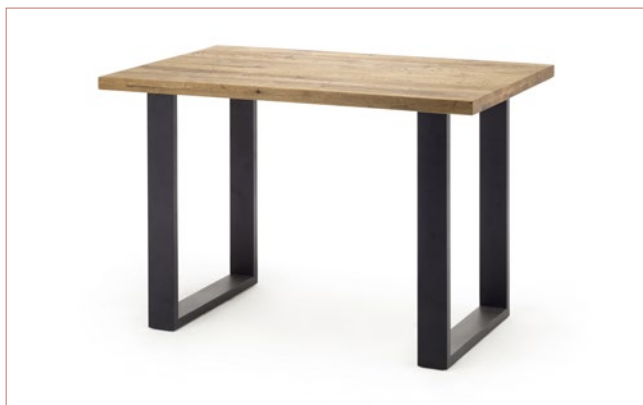
C2D160 .. Gestell Stahl anthrazit lackiert, 120 x 40 mm

Plattenstärke: ca. 60 mm Flächenbelastung 90 kg