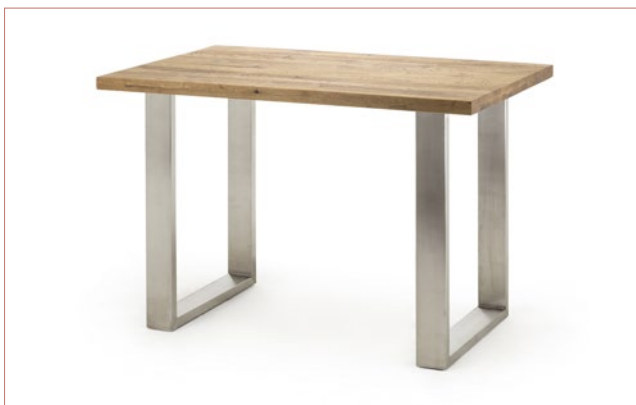
CAD160 .. Gestell Edelstahl gebürstet, 120 x 40 mm