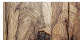
..... EW - Wildeiche / lackiert

Für die Herstellung der Tische wird massives Eichenholz aus allen Teilen Europas verwendet. Durch die naturbedingten Merkmale und die Herkunft der Hölzer entsteht eine verschiedenartige Optik.