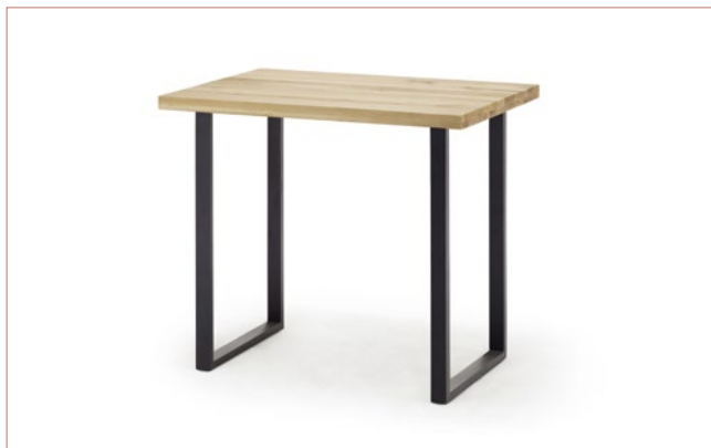
C2C120 .. Gestell Stahl anthrazit lackiert, 60 x 30 mm

Plattenstärke: ca. 60 mm Flächenbelastung 90 kg