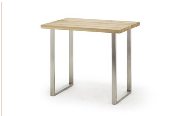
CAC120 .. Gestell Edelstahl gebürstet, 60 x 30 mm