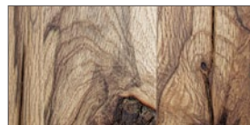
..... EW - Wildeiche / lackiert

Für die Herstellung der Tische wird massives Eichenholz aus allen Teilen Europas verwendet. Durch die naturbedingten Merkmale und die Herkunft der Hölzer entsteht eine verschiedenartige Optik.