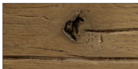
..... EB - bassano / lackiert