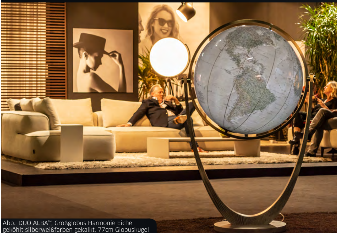
Abb.: DUO ALBA™, Großglobus Harmonie Eiche geköhlt silberweißfarben gekalkt, 77cm Globuskugel