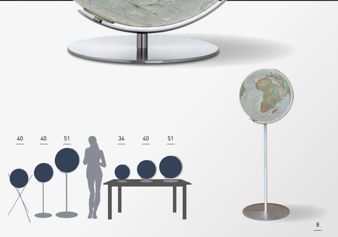
Abb.: DUO ALBA™, Standmodell Regent Edelstahl, 40cm Globuskugel Kristallglas