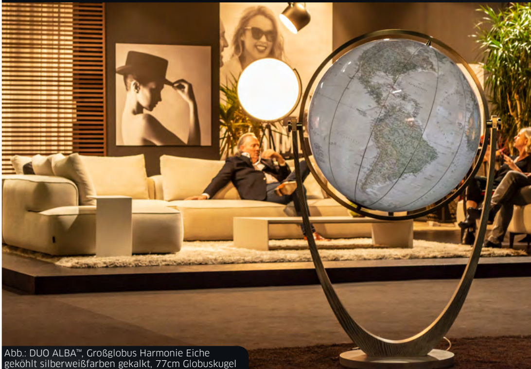
Abb.: DUO ALBA™, Großglobus Harmonie Eiche geköhlt silberweißfarben gekalkt, 77cm Globuskugel