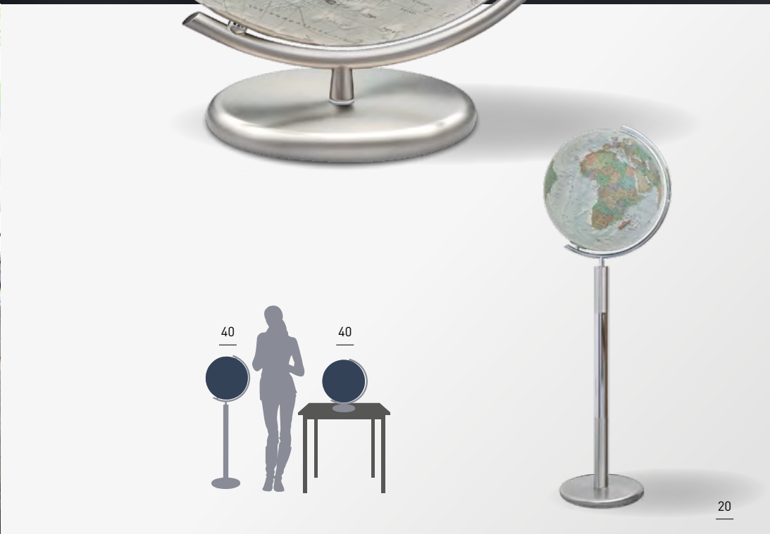
Abb.: DUO ALBA™, Standmodell Imperator Edelstahl, 40cm Globuskugel Acrylglas mit Swarovski Kristallen