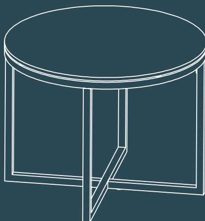
TABLE A CAFE

Dimensions : Ø55x45 CM Poids Net : 6 KGS