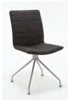
8861-02-27x Stativstuhl, Edelstahl gebürstet, Bezug »Bogota« B 46 H 89 T 60 Sh 49 cm