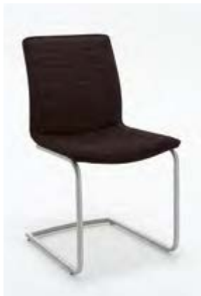
8851-02-27x Schwingstuhl, Rundrohr, Edelstahl gebürstet, Bezug »Bogota« B 46 H 89 T 60 Sh 49 cm